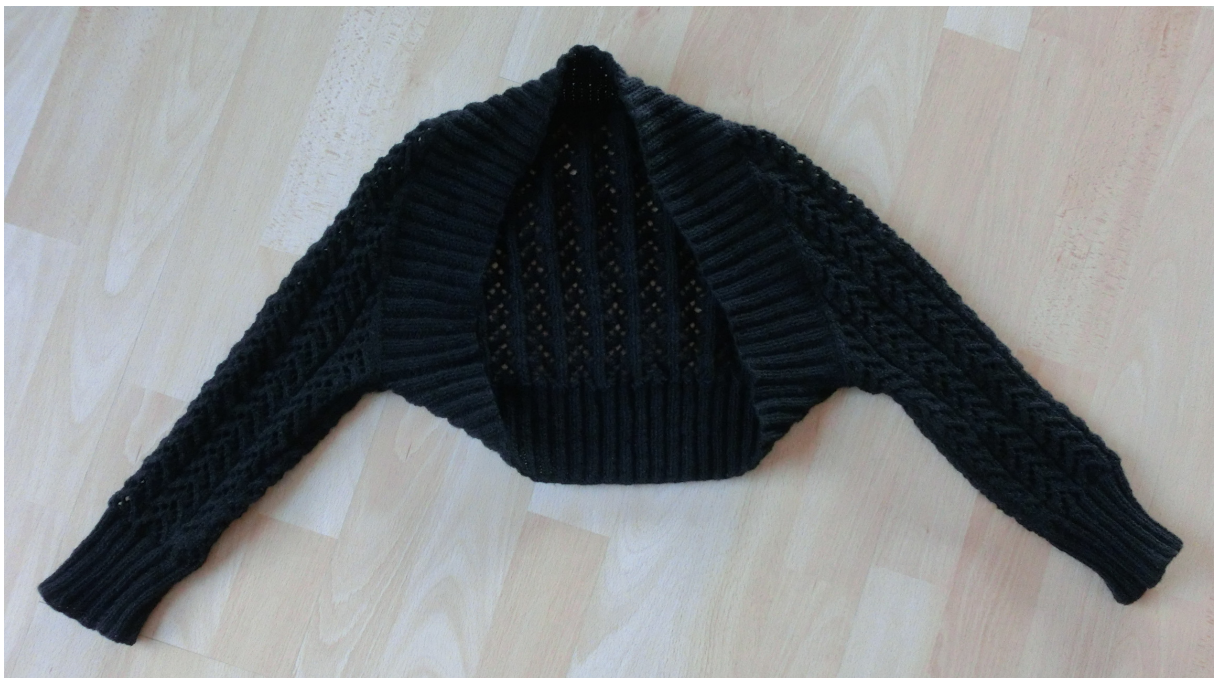
Merin - 2015

Coudre les manches et les bords de côtes.